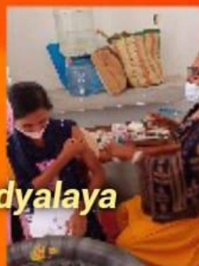
Bamanpukur Humayun Kabir Mahavidyalaya Vaccination Camp Second Dose Vaccine Date:26.1.2022